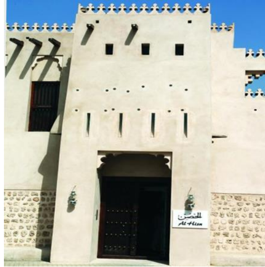
مكتبة الشارقة القديمة والجديدة - الموقع الرسمي لمكتبة الشارقة العامة