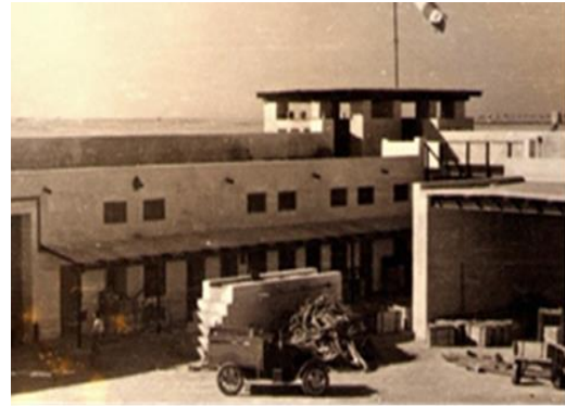
صور نادرة وقيمة لأول فندق بالشارقة - المصدر جريدة البيان