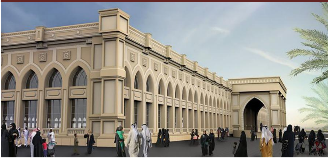
مدينة الشارقة للنشر - الموقع الرسمي